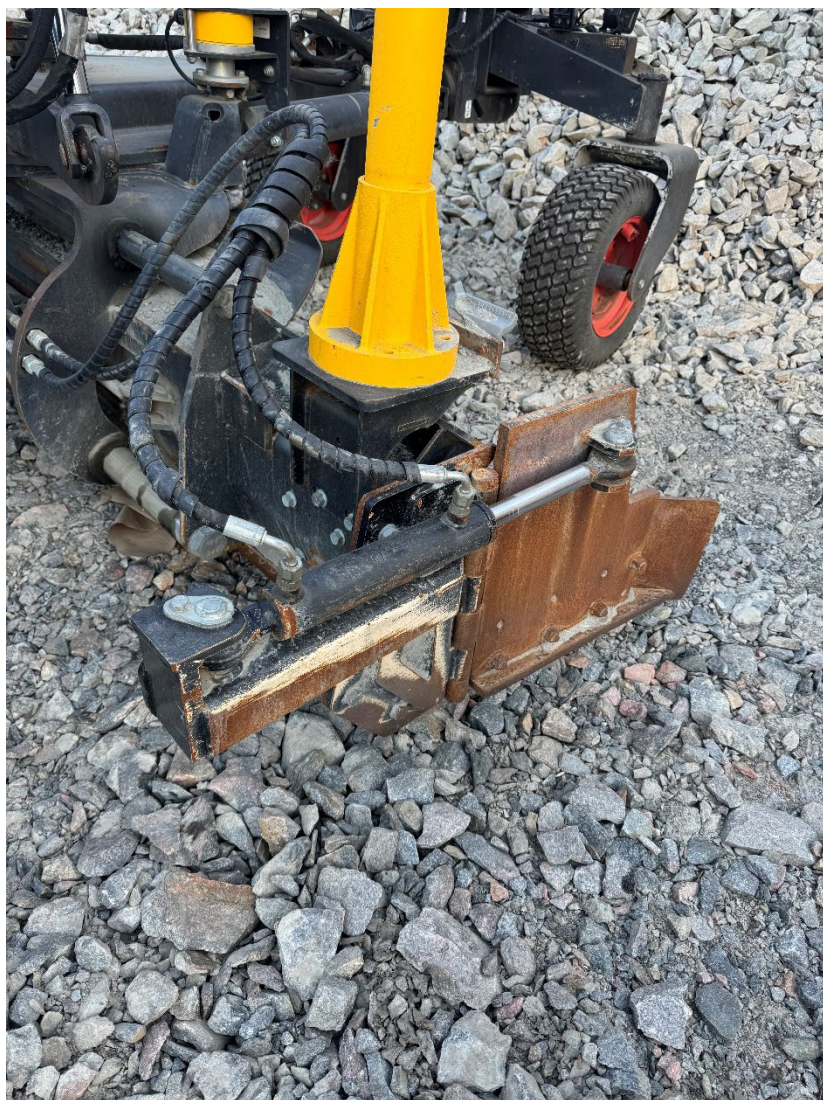
Påbyggd hydraulisk sidvinge som aktiveras genom att växla mellan sidoförskjutning och vinge.