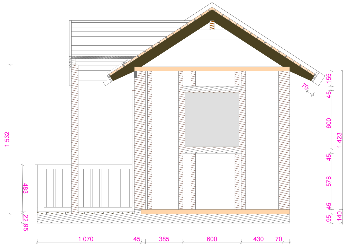
V4 SEKTION GENOM VÄGG4 1:20