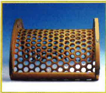
Såll Screen Sieb