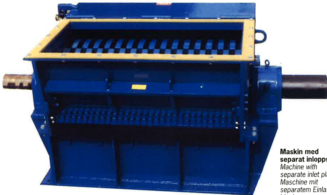
Maskin med separat inloppsplåt Machine with separate inlet plate Maschine mit separatem Einlassblech

I denna kraftiga rivare är det möjligt att sönderdela de flesta typer av material. Verktyg och såll anpassas efter materialtyp.